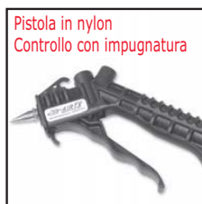
Modello 48011 con ugello 48008

Potete scegliere fra tre tipi di pistole: nylon con impugnatura, cromate con controllo a pollice e metalliche con impugnatura