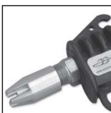
Modello 48012 con ugello 48007