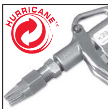
Modello 48312 con ugello HURRICANE 48005