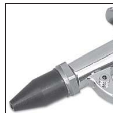
Modello 48215 con ugello 48006