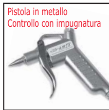
Modello 48311 con ugello 40008