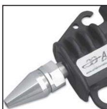
Modello 48013 con ugello 48009