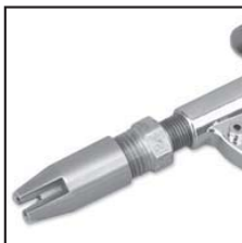
Modello 48212 con ugello 48007