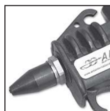
Modello 48015 con ugello 48006