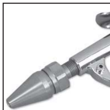
Modello 48214 con ugello 40009