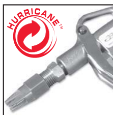
Modello 48313 con ugello HURRICANE 40005

Avete necessità di far arrivare l'aria compressa in punti difficili? Usate uno di questi prodotti