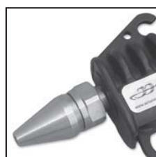
Modello 48014 con ugello 40009