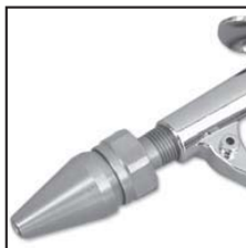
Modello 48213 con ugello 48009