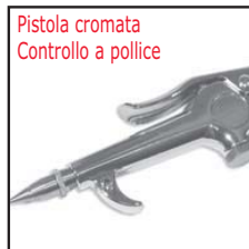
Modello 48211 con ugello 48008